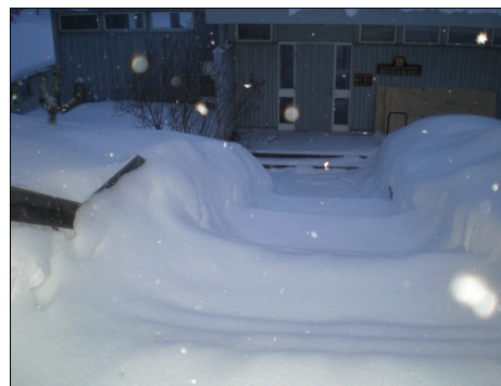
Ingång till klubbhuset, 19 feb 2010