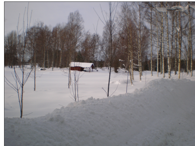
Mitten av februari, ladan på 12:an väntar på några golfspelare i sin ensamhet. Slutet av feb betade en älgko med sin kalv på en fälld asp bakom ladan.