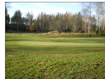
17:nde green, hösten 2008