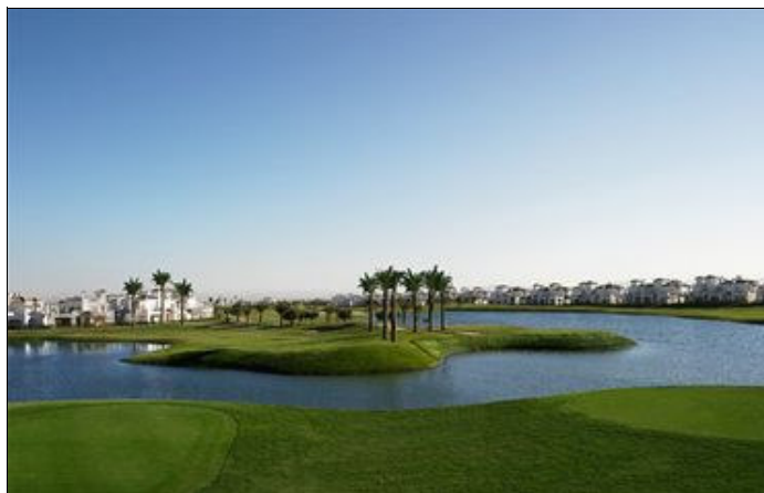
La Torre golf course, det är ganska vackert, eller hur?

Norge 22431400 · www.gotiagolf.no | info@gotiagolf.no