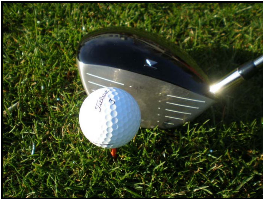
Ny driver, ny boll och en halvskaplig peg. Tänk om det vore vår! Det är faktiskt bara 183 dagar till 1:a maj 2009.

Nr 2/2008 Medlemskrift för Söderhamns Golfklubb