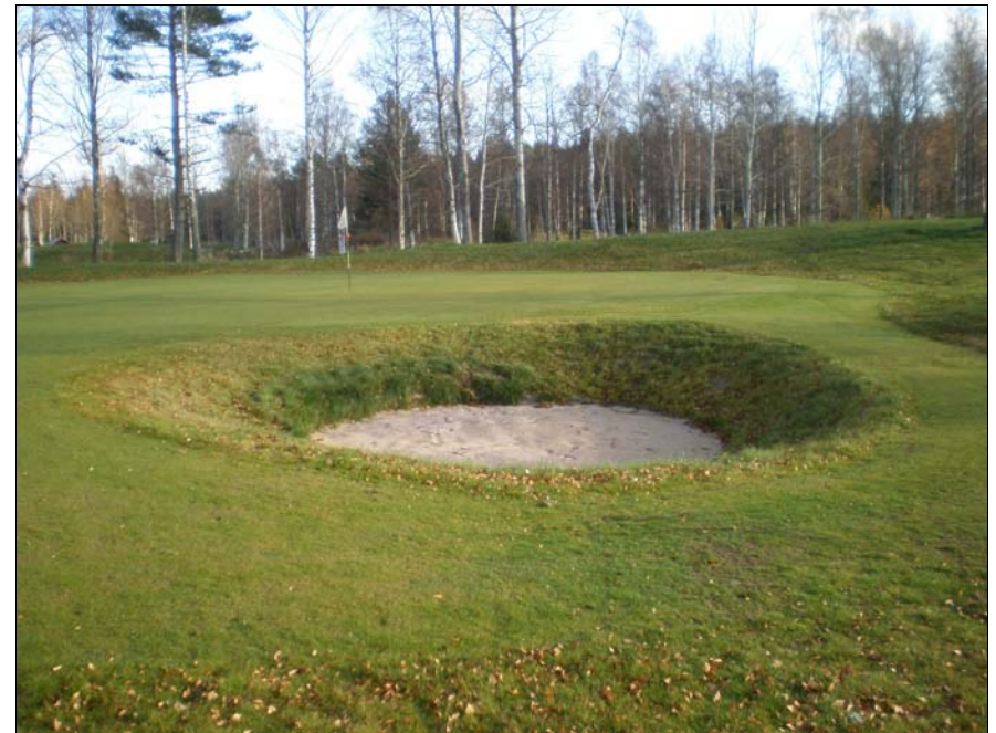
Nya green på 1:an som den ser ut idag den 29 oktober klockan 11.05. En riktig otäck bunker har också kommit till på 1:an.